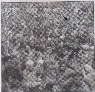
Protesters in Lahore on Thursday. —AFP

Christianity in Pakistan is a hardline protest in Lahore on Thursday. —AFP