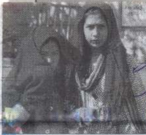
OUR STAFF REPORTER BHOPAL

Intensity of heat increased consistently in the state capital due to sudden rise in temperature during day time on Friday. The city recorded a maximum temperature of 28.3 degree Celsius which was slightly above normal while it recorded a minimum temperature of 13.3 degree Celsius which was also slightly above normal.